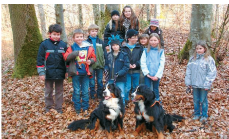
Tiergestützte Pädagogik in der freien Natur