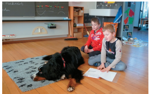
Filia, die geduldige Zuhörerin