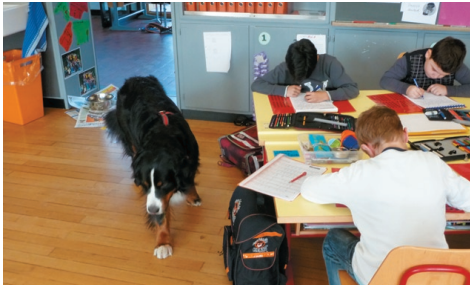
Konzentriertes Arbeiten mit Filia